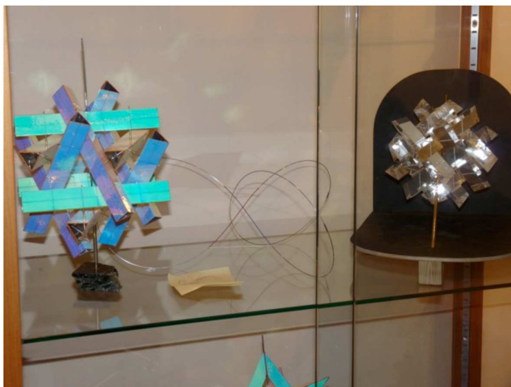
Seconde tablette : arêtes internes du dodécaèdre, au milieu un nœud de trèfle régulier (Philippe Rips) 7 .